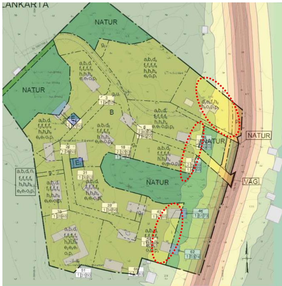
Bilden visar ett montage där plankartan har överlagrats med resultatet av bullerutredningen för maximala bullernivåer. De tre inringade områdena visar de delar av bostadsbyggrätten där bullervärdena överstiger riktvärdet.

På den befintliga bostadsfastigheten Irsta-Olsta 2:10 finns redan en bostad med uteplats och trädgård. På den fastigheten planläggs en remsa allra närmast väg 543 med prickmark där bullervärdena överstiger riktvärdet för fasad och där byggnader inte får placeras med hänsyn till trafiksäkerheten och sikten på väg 543.