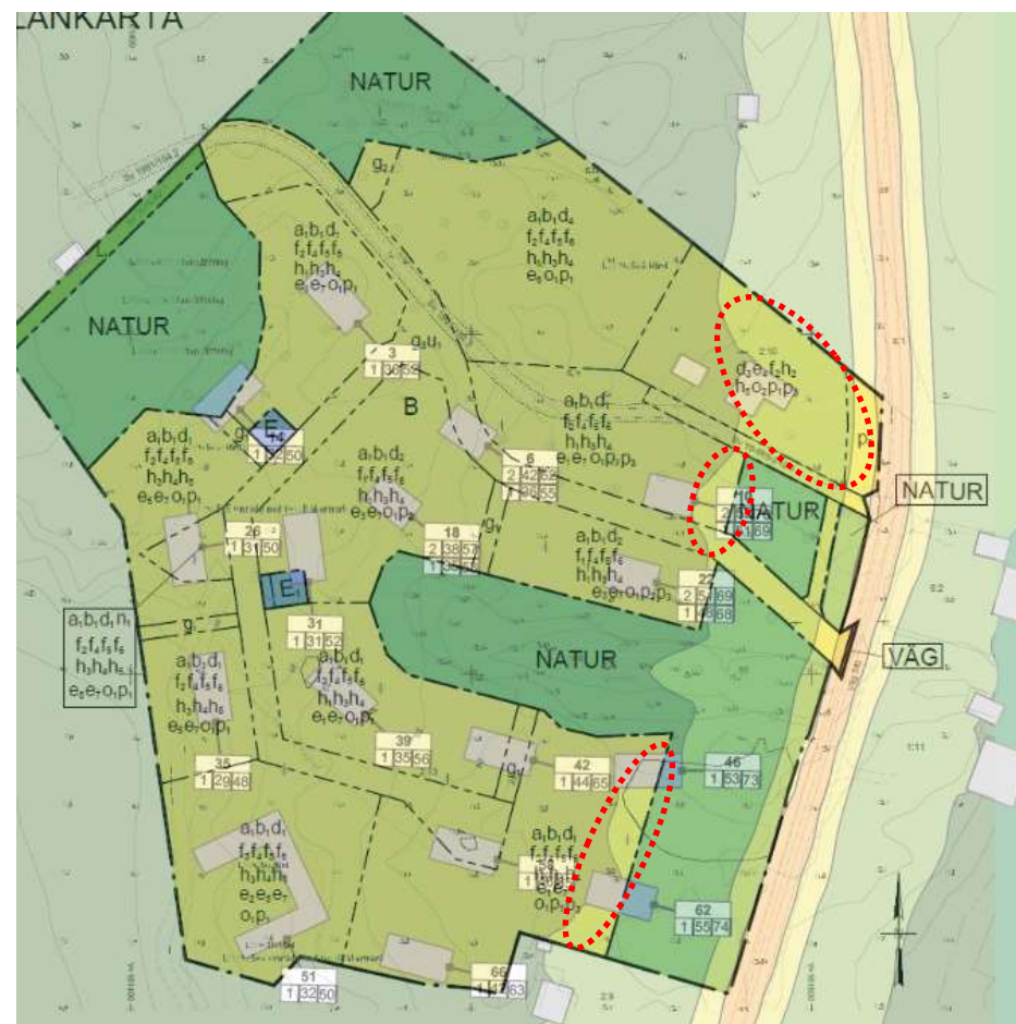
Bilden visar ett montage där plankartan har överlagrats med resultatet av bullerutredningen för ekvivalenta bullernivåer. De tre inringade områdena visar de delar av bostadsbyggrätten där bullervärdena överstiger riktvärdet.

både uteplatser och fasader. Marken närmast vägen planläggs därför som allmän plats (NATUR). Detta gör att de prognostiserade bullervärdena vid gränsen för bostadsbyggrätterna ganska väl motsvarar de förväntade utbredningarna för 50 decibel ekvivalentnivå respektive 70 decibel maximal nivå. På några delar av ytorna finns det fortfarande en risk att värdena överskrider men det finns ändå goda förutsättningar för att bostäderna som byggs där ska kunna få bullerskyddade uteplatser, särskilt om de förläggs på de västra sidorna av bostadshusen. Riktvärdet för buller vid fasad klaras med god marginal. För att säkerställa att uteplatser hamnar på en bullerskyddad plats införs bestämmelsen ( p_3 ).