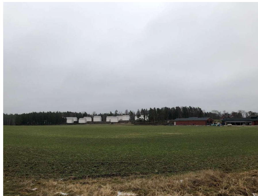
Bilden är ett fotomontage taget från sydväst och visar ungefär hur exploateringen kan komma att se ut.

Västerås stad upplever ett ökat bebyggelsetryck i Irsta genom ett flertal förfrågningar om exempelvis förhandsbesked. För att undvika kumulativ skada på riksintressets värden och värna den värdefulla kulturmiljön vill staden att bebyggelsen regleras genom detaljplan. Inom detaljplan krävs lov för att exempelvis måla om byggnader och ändra markförhållanden på tomterna och detaljplanens intentioner om att värna Irstas kulturhistoriska värden kan på så vis bibehållas. Utanför detaljplan krävs det inte bygglov för att färga om byggnader, göra mindre tillbyggnader eller ändra markens topografi, vilket riskerar att skada riksintressets värden på sikt. Så för att undvika kumulativ skada på riksintresset vilket en spridd bebyggelse kan ge, skapas här en ny årsring som istället bidrar till bebyggelsekontinuiteten i Irsta.