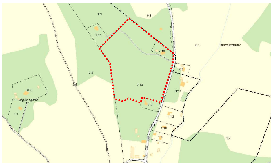
Kartbild över Irsta-Olsta med planområdet illustrerat i röd streckad linje.