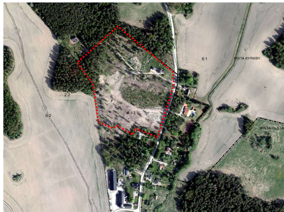
Ortofoto över Irsta-Olsta med planområdet i röd streckad linje.