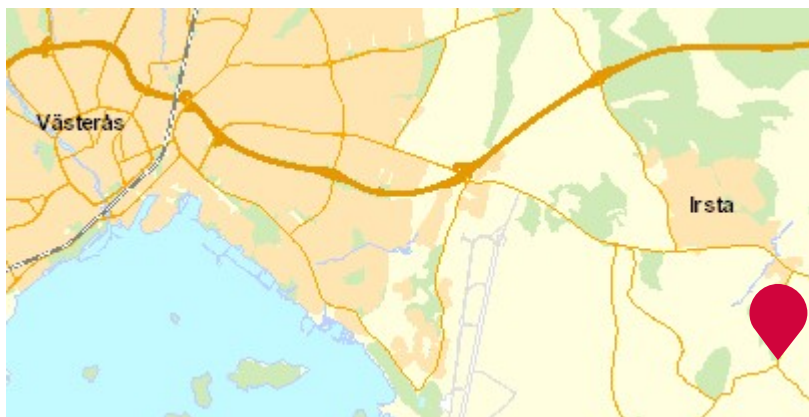
Planområdets läge i förhållande till Västerås och Irsta