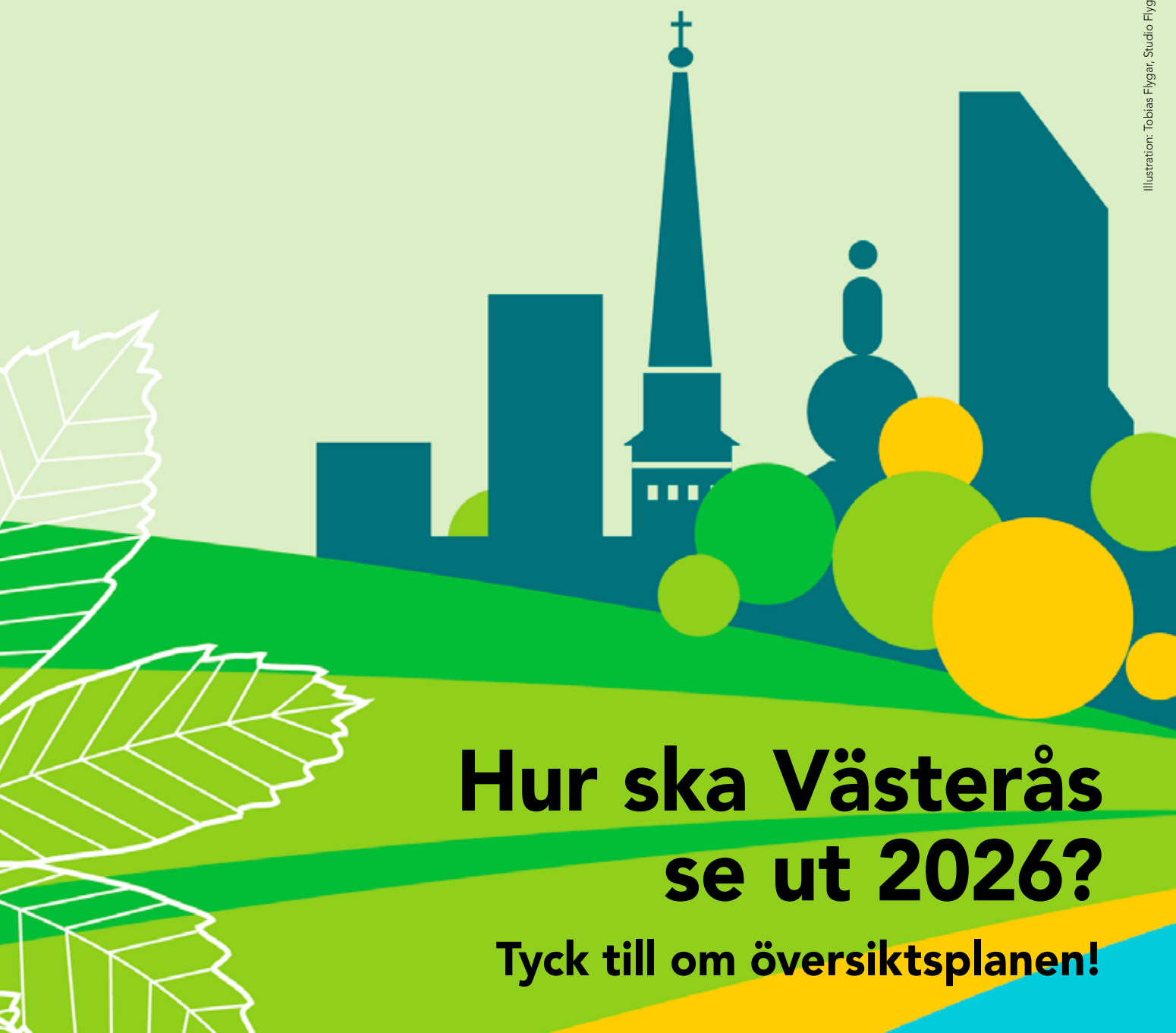
Illustration: Tobias Flygar, Studio Flygar