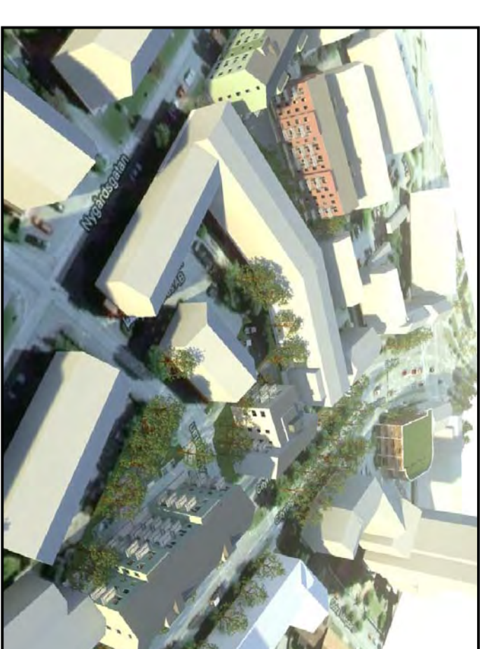
Vy mot sydost över ny planerad bebyggelse

Ny bebyggelse i 4 våningar, ca 40 lägenheter. Garage under mark.