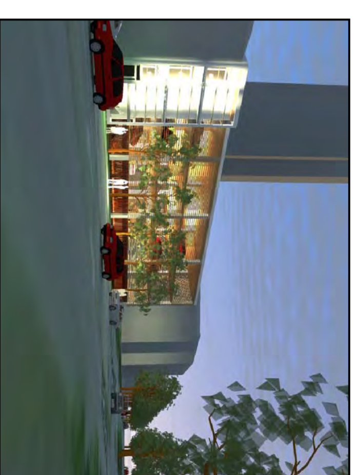
Vy mot parkeringshus på Gude 9

Parkeringshus i träfasad med "grönt" tak, i 4 våningar.