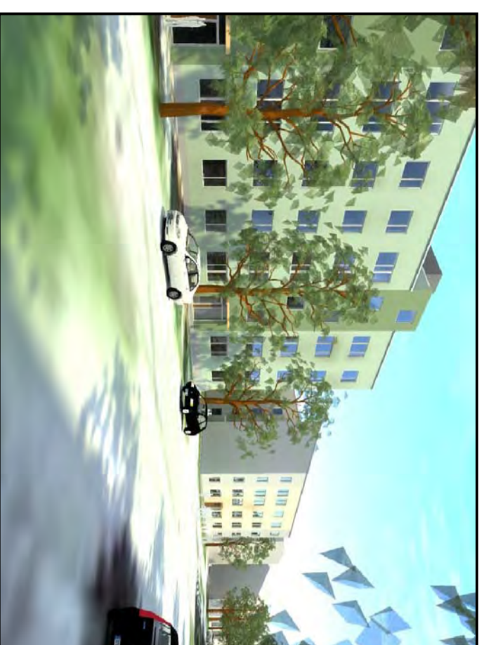
Vy längs Norra Ringvägen