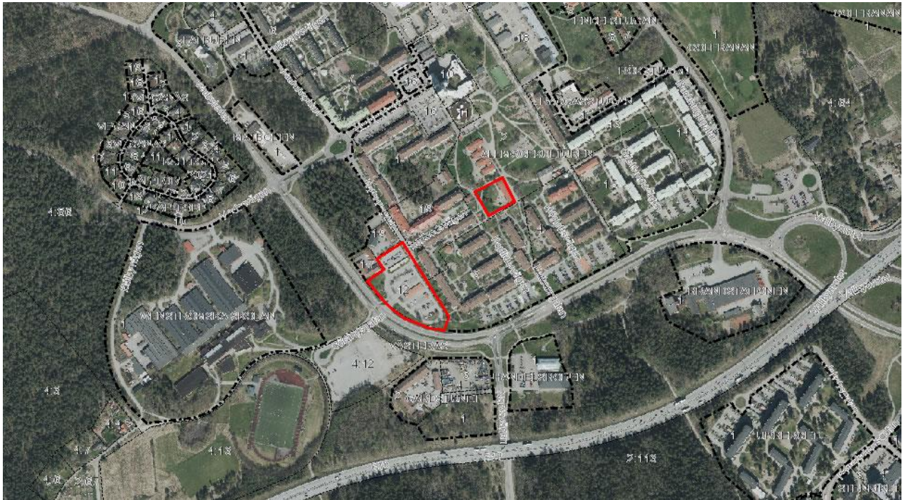
Ortofoto med avgränsning av byggnadsområden inritade