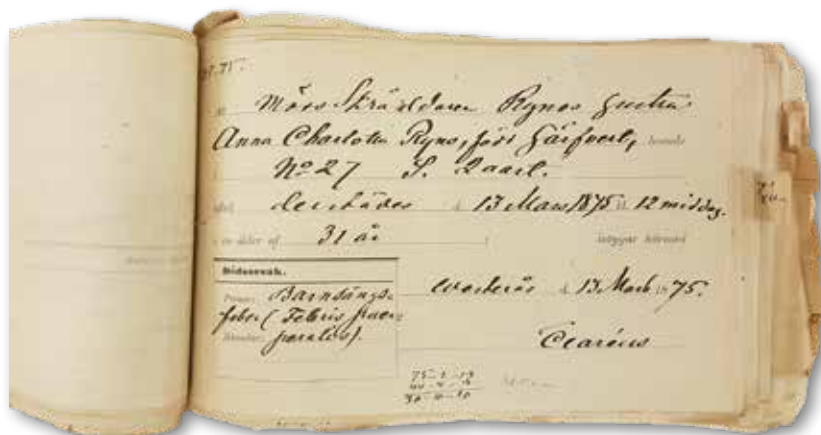
Dödsattest utfärdad av stadsläkare för kvinna död i barnsängsfeber 1875.