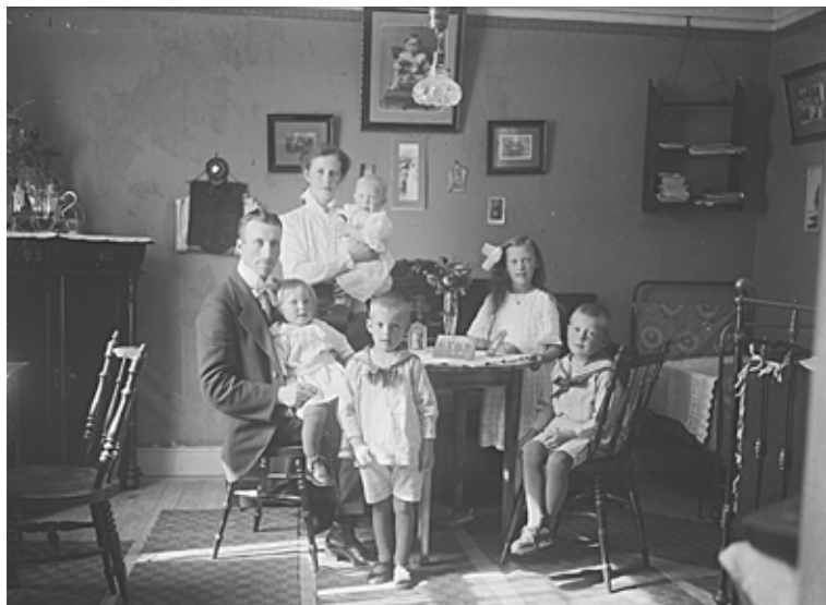
Familjen Svensson i Johannedal 1919.