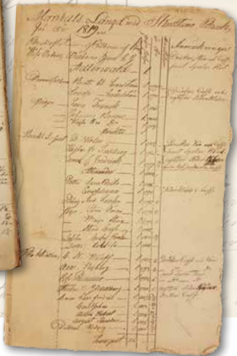
"Tomte-Längd" öfver Westerås Stad, 1809. Mantalslängd för Skultuna bruk år 1819.