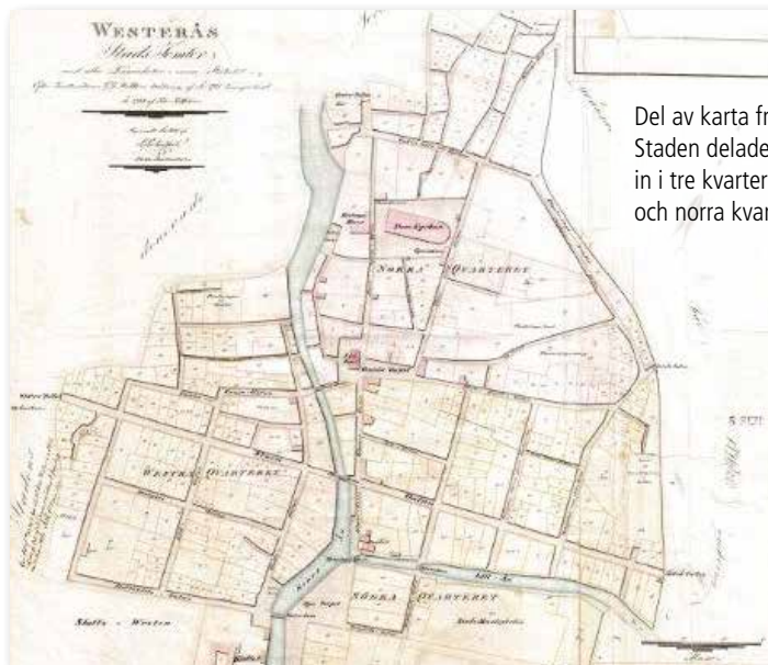
Del av karta från 1751. Staden delades på 1700-talet in i tre kvarter – västra, södra och norra kvarteret.