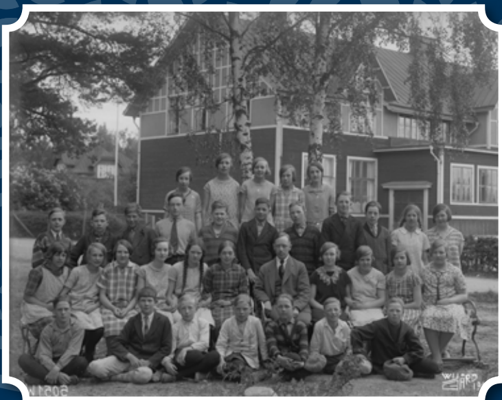
Jakobsbergsskolan år 1930.