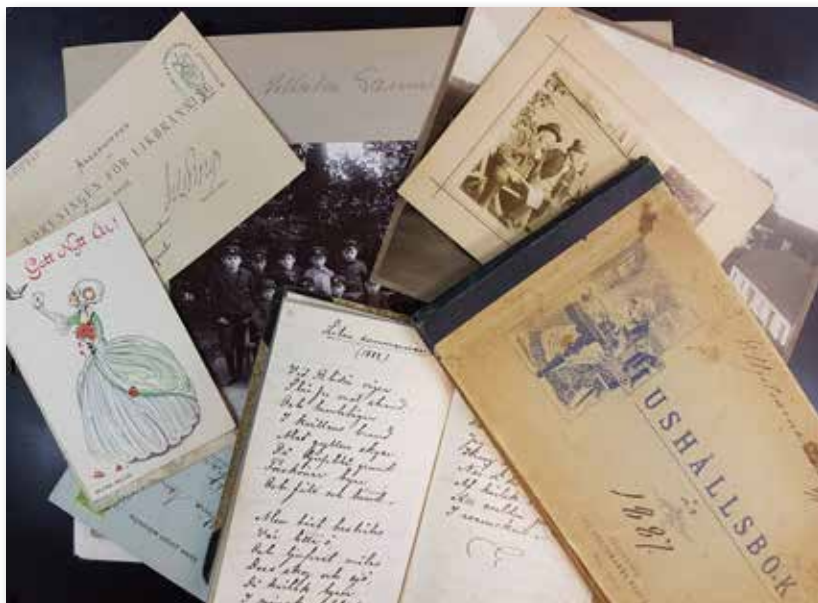
Handlingar ur Elviska arkivet.