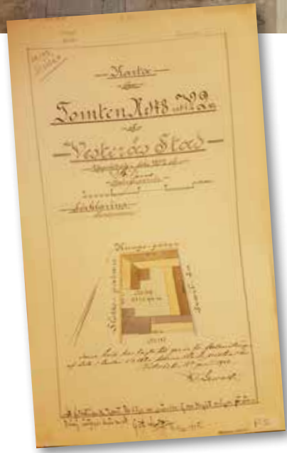
Byggnadsritning 1888 till nytt boningshus, Västra kvarteret nr 18-19.