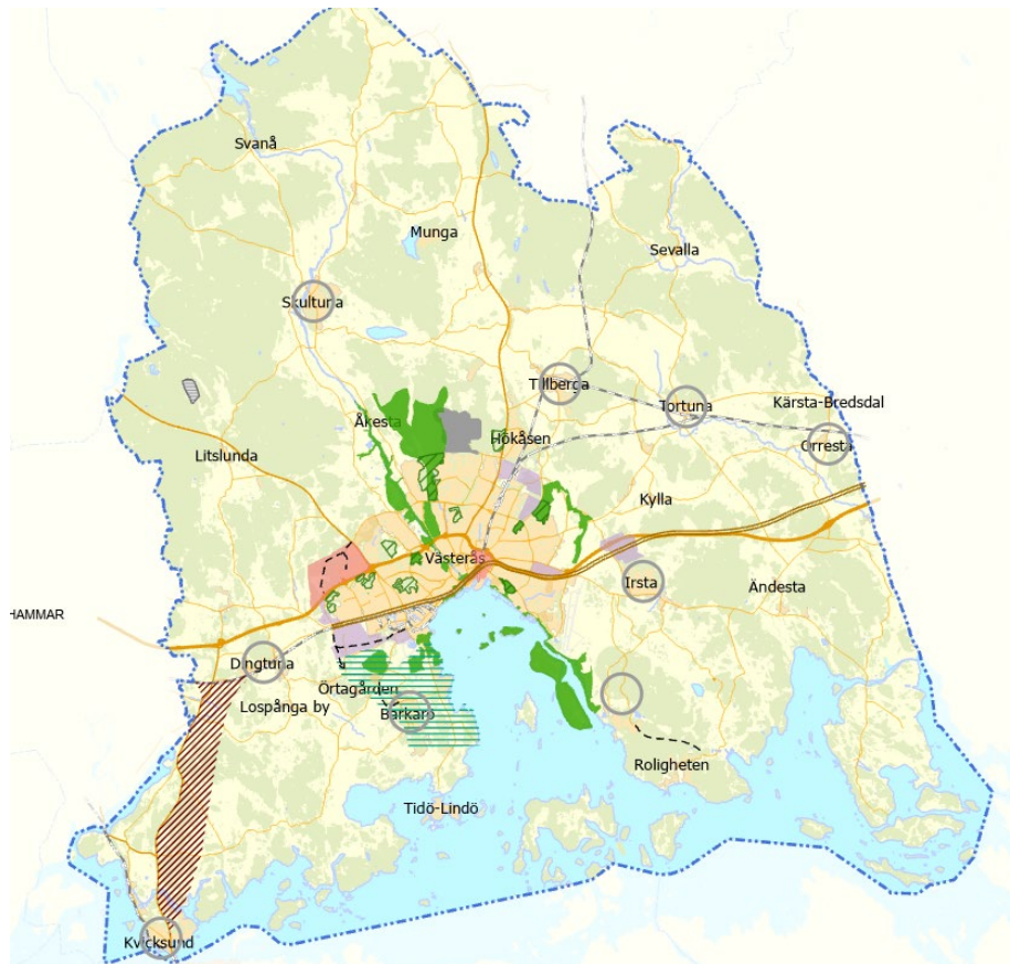
Bebyggelseutvecklingen i Västerås tätort till 2026

Till ÖP hör en hållbarhetsbedömning, som även inkluderar en miljökonsekvensbeskrivning. Hållbarhetsbedömningen är framtagen av Tyréns AB på uppdrag av Västerås stad. Den beskriver i vilken utsträckning ÖP förväntas bidra till eller motverka en utveckling som är hållbar ur ett ekologiskt, kulturellt, socialt och ekonomiskt perspektiv. Den har till syfte att integrera hållbarhetsfrågorna i planeringen och därmed främja en hållbar utveckling.