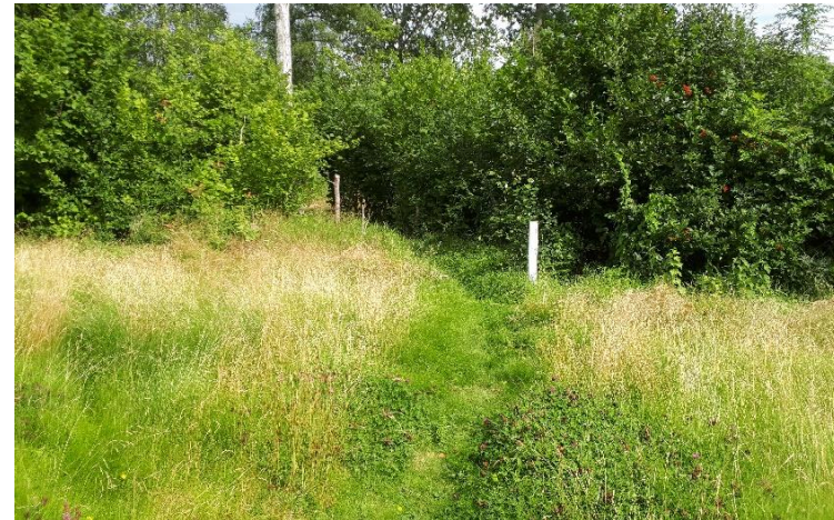
Upptrampad stig på Västerås Stads fastighet Grissle 1:9. Marken har tidigare varit privatiserad och gräset klippts av stugägare i strid med strandskyddet, men under 2019 har det fått växa fritt. Allmänhetens tillgång och förutsättningar för djur och växtliv har förbättrats.

Strandskyddet upphävs inom kvartersmark ( a 1 ). Särskilt skäl till upphävandet är att området redan har tagits i anspråk på ett sätt som gör att det saknar betydelse för strandskyddets syften (Miljöbalken 7 kap 18c § 1.). Strandskyddet upphävs inte inom den kvartersmark på fastighet Tångsta 1:2 som inte innefattas av gällande områdesbestämmelser för området.