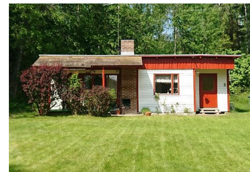
Fritidshus och nybyggda villor i Tångsta