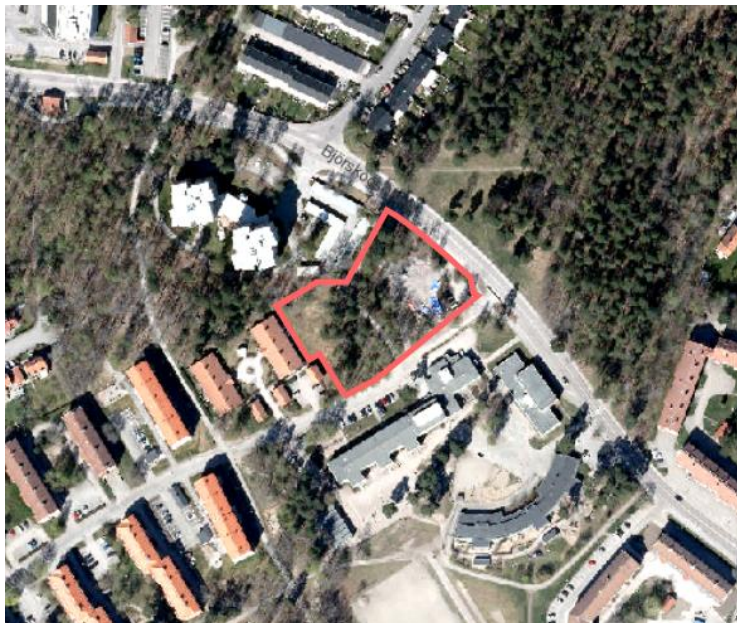
FIGUR 1 - FASTIGHETEN FORSTMÄSTAREN 1

Markanvisningsområdet utgörs av fastigheten Forstmästaren 1 och är cirka 5800 kvm stort. Omgivande bebyggelse utgörs av en F-6 skola i söder, ett seniorboende som gränsar till fastigheten i norr samt gruppboende väster om fastigheten. På andra sidan Björkskogsgatan finns en av Västerås nio bostadsnära skogar, Malmbergsskogen, som är ca 11 hektar stor tallskog.