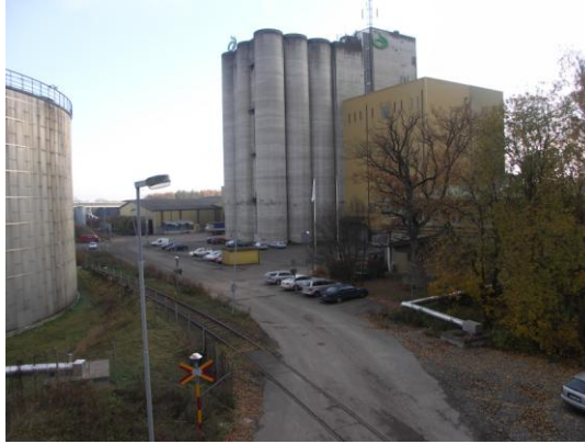
Vy över Oljecisternen 1 och Fullriggargatan