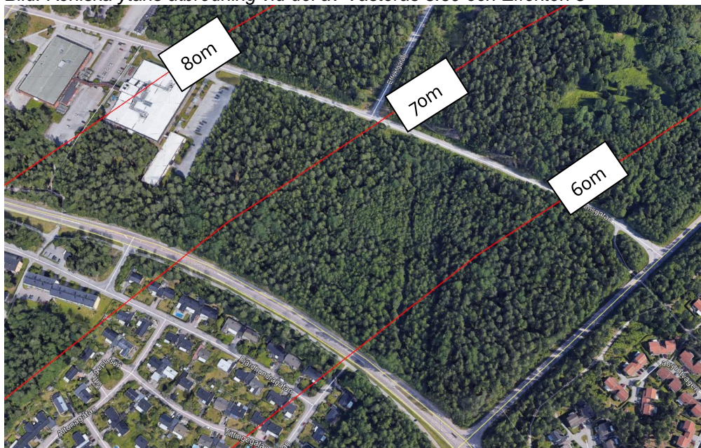
Bild: Koniska ytans utbredning vid del av Västerås 3:69 och Effekten 8