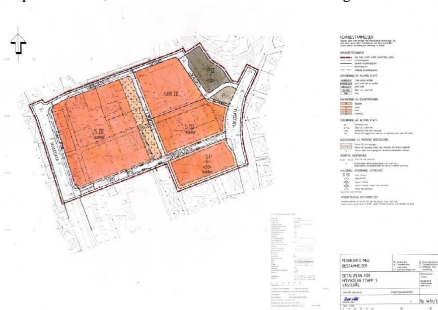
Gällande detaljplan Dp 1431 k

För området gäller översiktsplan ÖP 2026 (2017-12-07), FÖP 38 (1992-01-31), detaljplanen Dp 1431K (laga kraft 2000-08-15). Det pågår arbete med fördjupade översiktsplan FÖP 71, dock beräknas arbetet vara klart tidigast till hösten 2020.