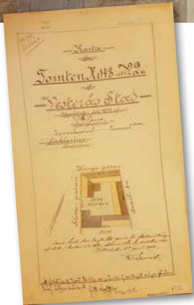
Byggnadsritning 1888 till nytt boningshus, Västra kvarteret nr 18-19.